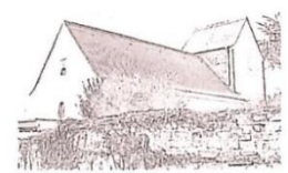
Mariä Himmelfahrt Nünschweiler