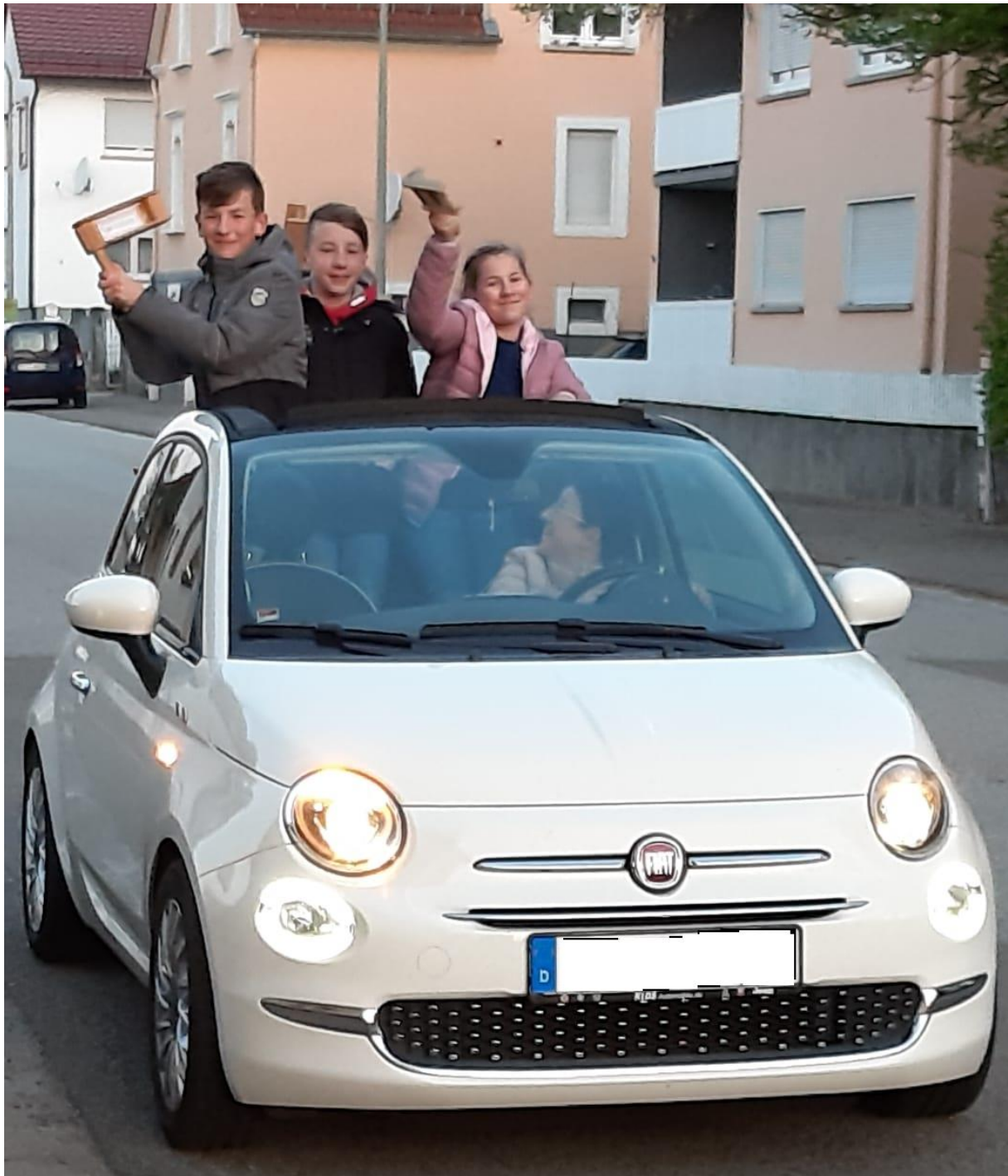
Unterwegs im Auftrag des Herrn - Rätschen im Jahr 2019 in Höhrfröschen