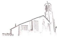
St. Peter Petersberg