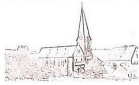
St. Antonius Maßweiler