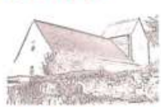
Mariä Himmelfahrt Nünschweiler