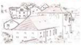
St. Margaretha Thaleischweiler-Fröschen