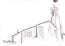
St. Peter Petersberg