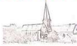
St. Antonius Maßweiler