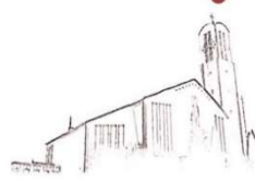
St. Peter Petersberg