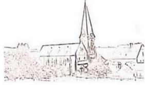
St. Antonius Maßweiler