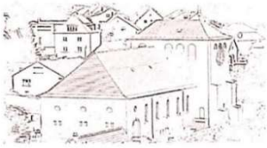
St. Margaretha Thaleischweiler-Fröschen