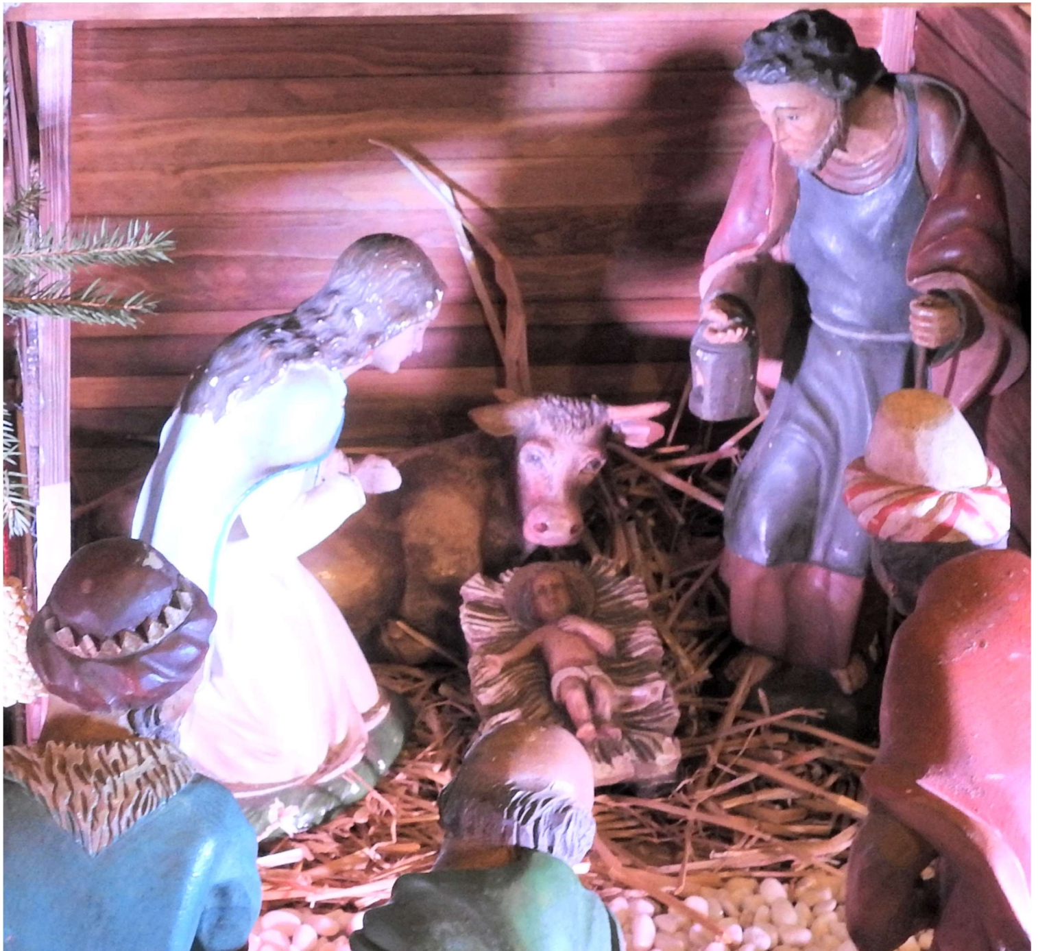
Weihnachtskrippe Maßweiler (2021)