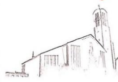
St. Peter Petersberg