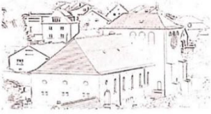
St. Margaretha Thaleischweiler-Fröschen