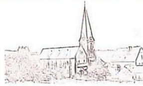
St. Antonius Maßweiler