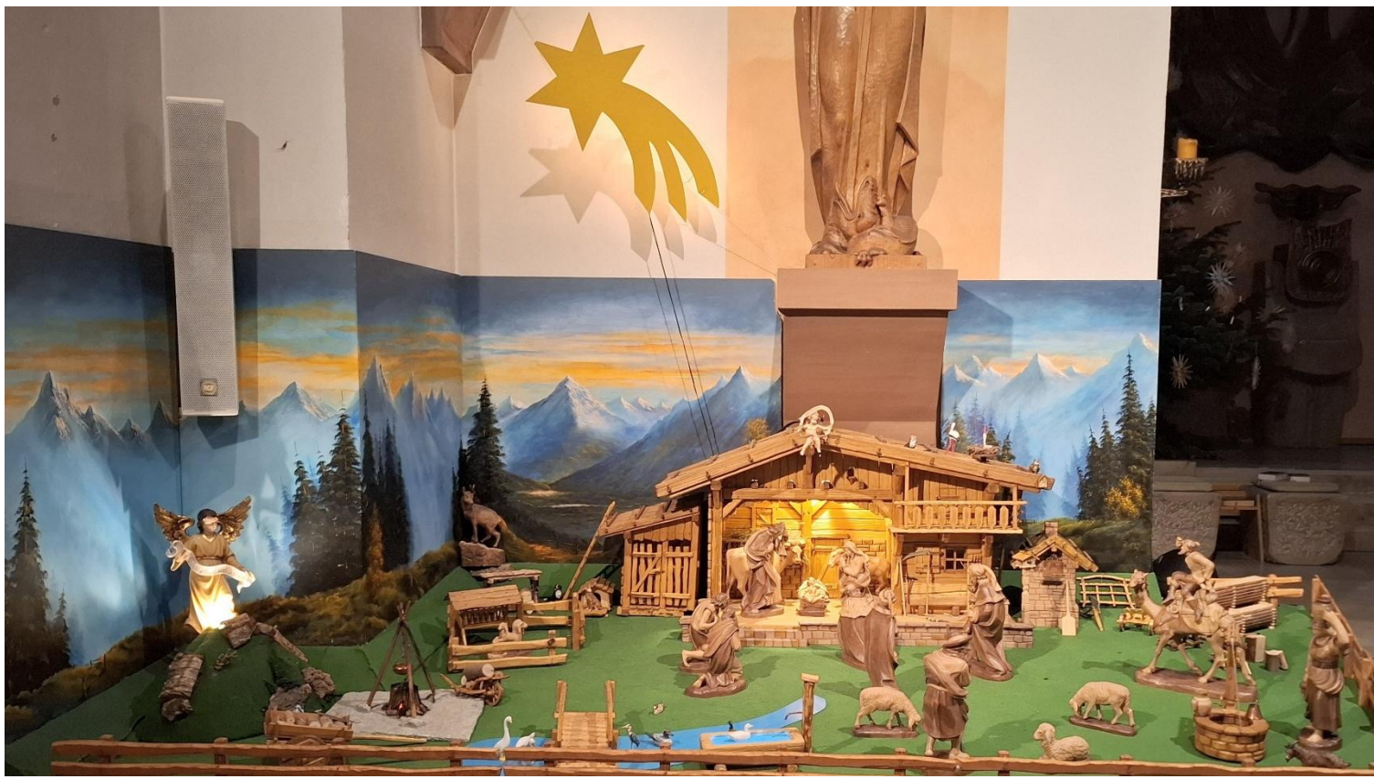
Weihnachtskrippe St. Margaretha, Thaleischweiler-Fröschen