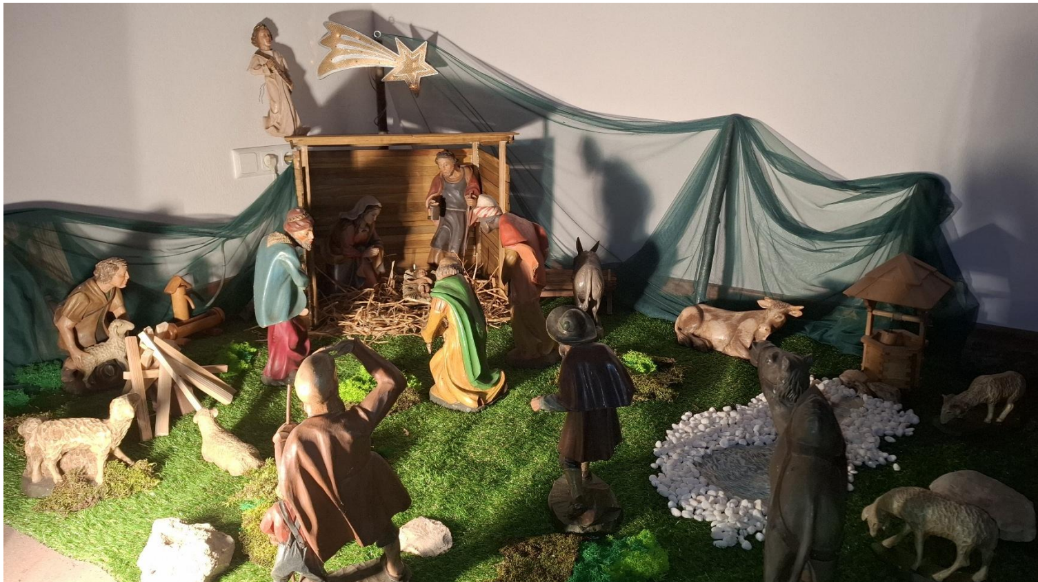
Weihnachtskrippe Mariae Himmelfahrt, Nünschweiler