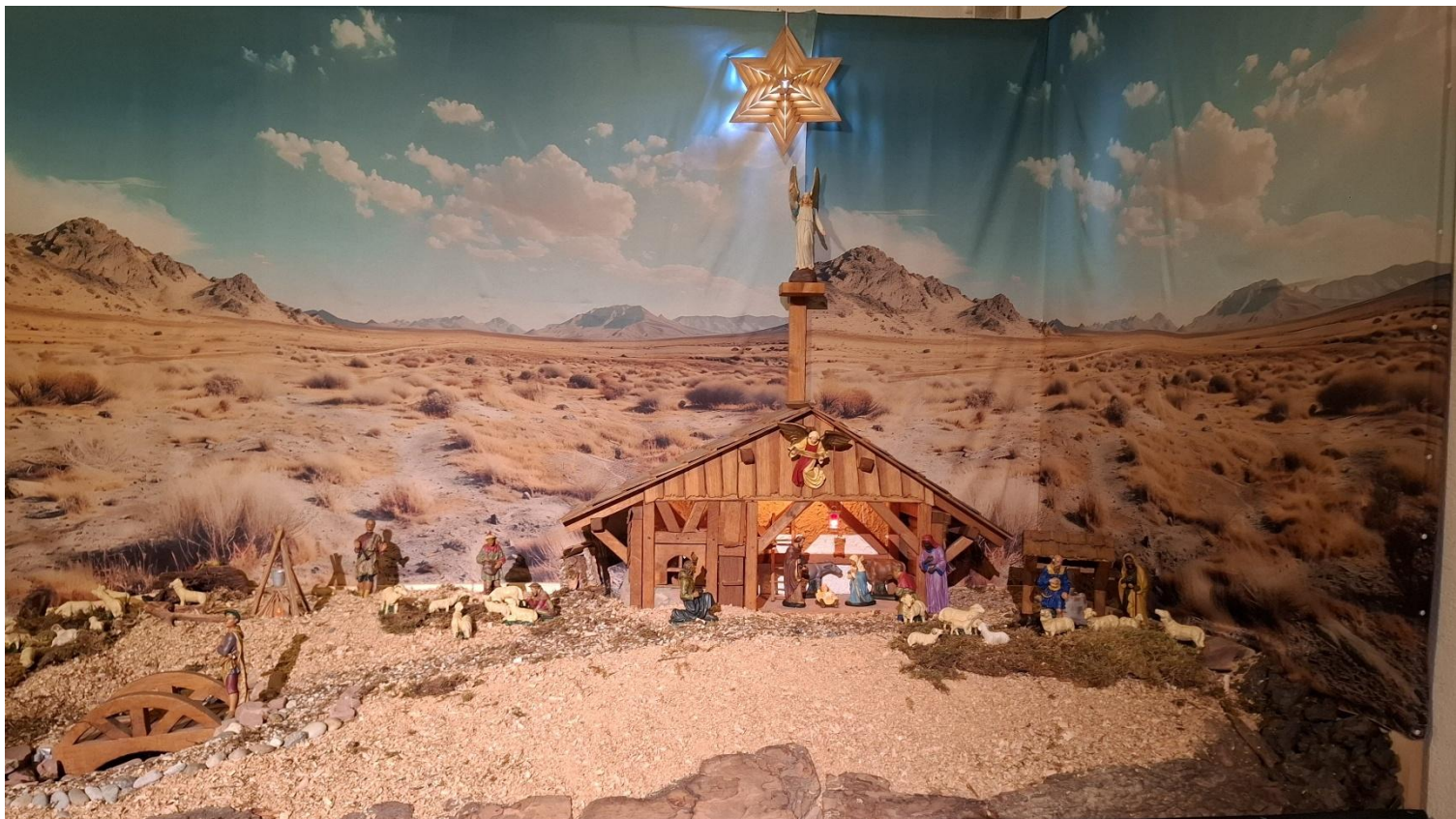
Weihnachtskrippe St. Peter, Petersberg