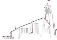
St. Peter Petersberg