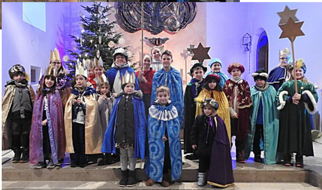
Teil der Sternsinger beim Abschlussgottesdienst