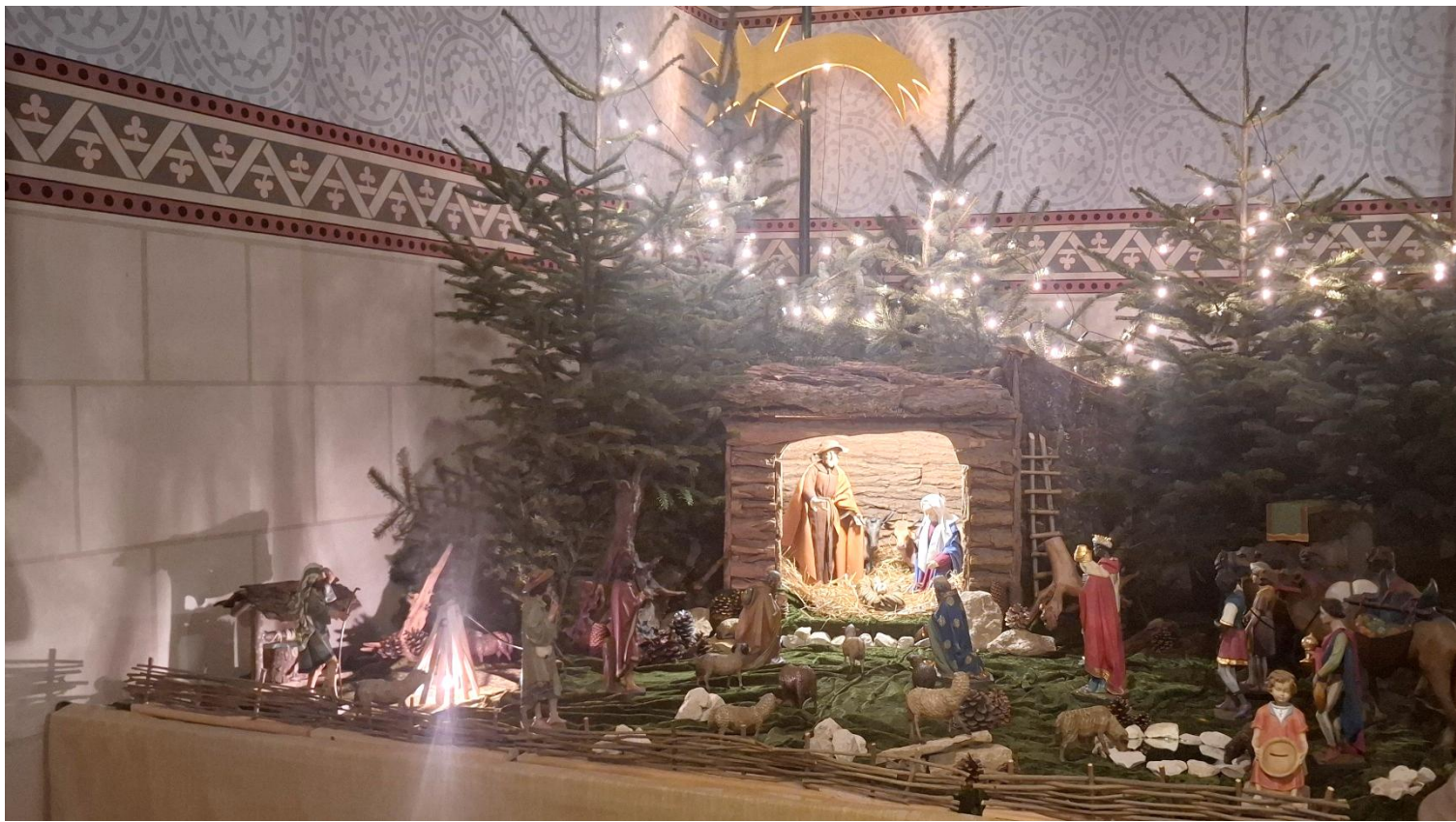
Weihnachtskrippe St. Antonius, Maßweiler