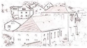
St. Margaretha Thaleischweiler-Fröschen