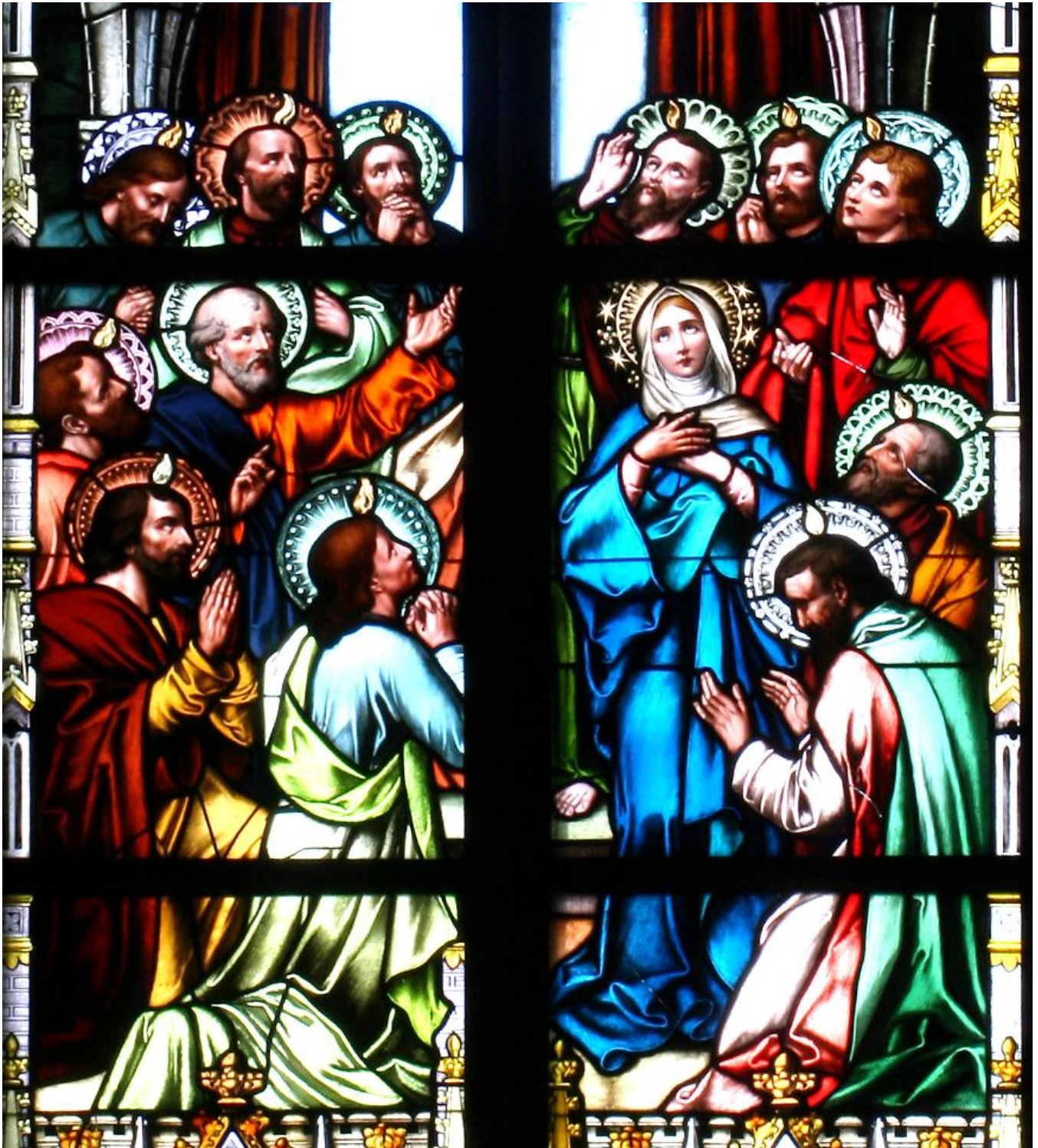
Pfingsten - Ausschnitt aus dem Fenster in der Kirche St. Antonius, Maßweiler