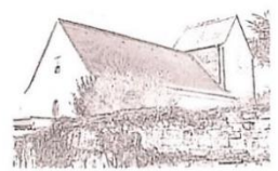
Mariä Himmelfahrt Nünschweiler